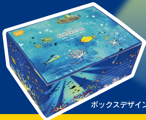
ボックスデザイン