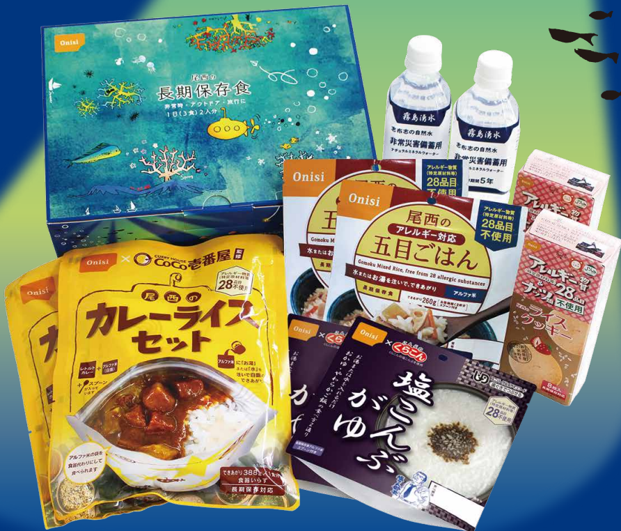
※写真・イラストはイメージ