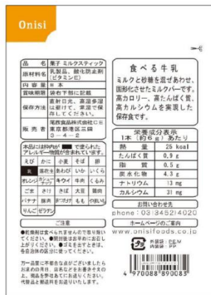
【旧パッケージ裏面】