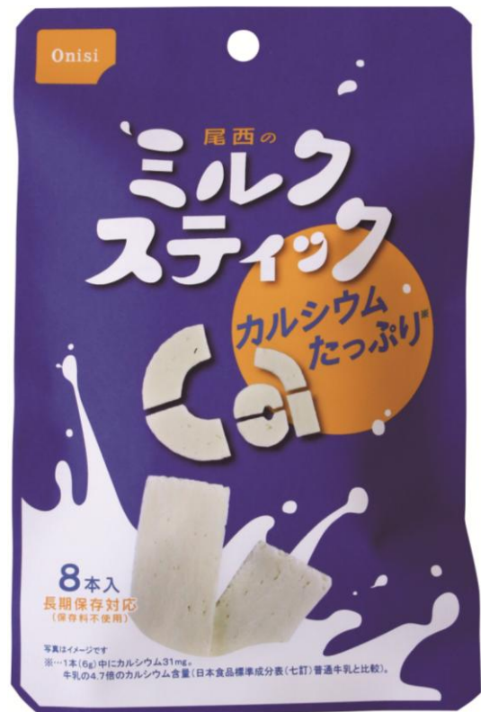
【新パッケージ表面】