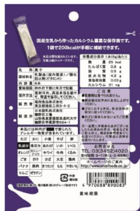
【新パッケージ裏面】