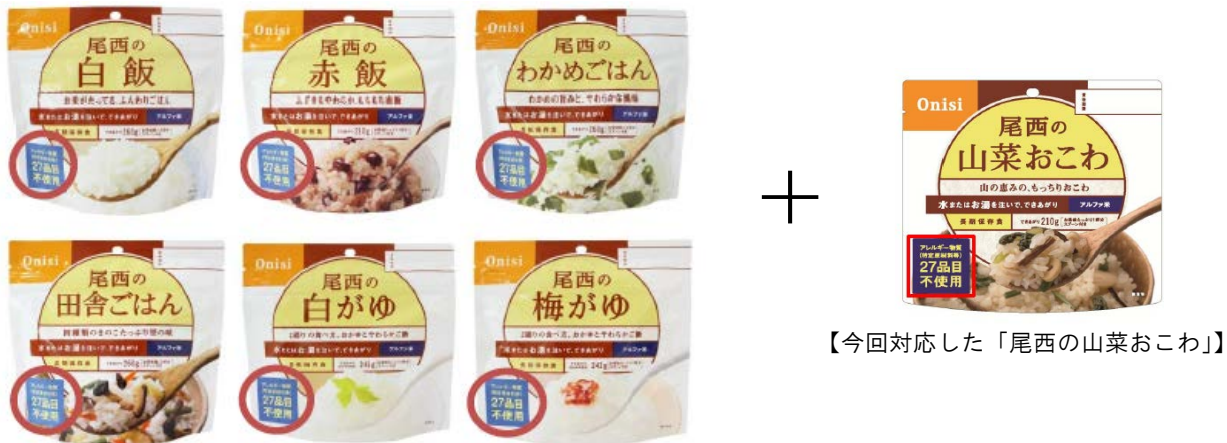
【今回対応した「尾西の山菜おこわ」】