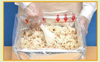
できあがりイメージ(写真は五目ごはんです)