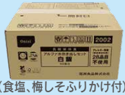
(食塩、梅しそふりかけ付)